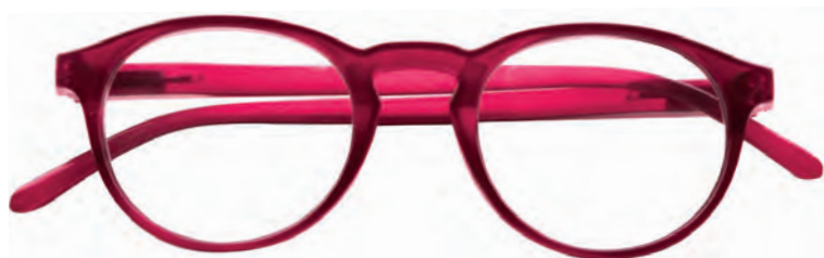
Mod. Round rosso