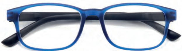
Montatura blu, aste nere