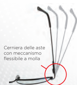
Cerniera delle aste con meccanismo flessibile a molla