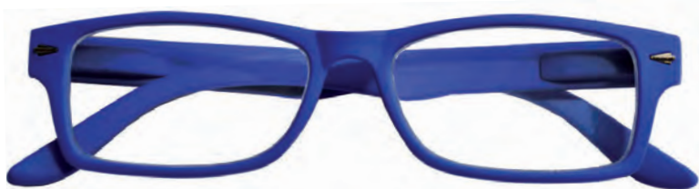
Mod. Boss blu