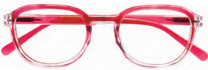
Mod. Shot rosso cangiante