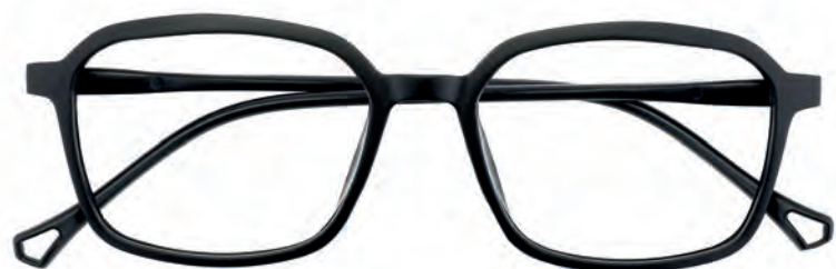
Mod. Silhouette nero