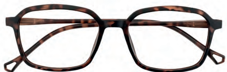
Mod. Silhouette tartaruga