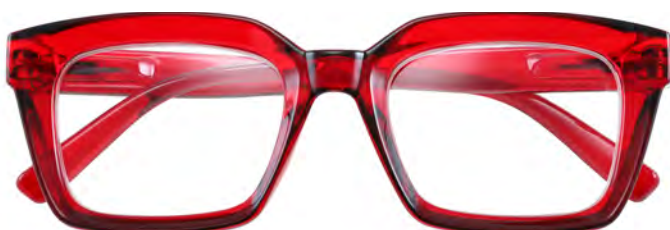
Mod. Brave rosso