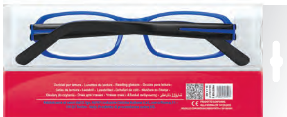
Vista posteriore della confezione.