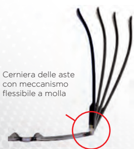
Cerniera delle aste con meccanismo flessibile a molla