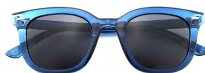
Montatura colore blu, lenti colore grigio