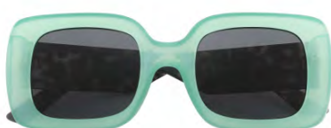
Montatura colore verde, lenti colore grigio