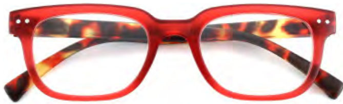
Mod. Royal rosso