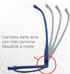
Cerniera delle aste con meccanismo flessibile a molla