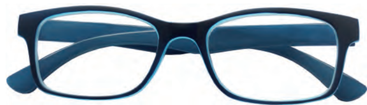
Mod. Freedom blu/azzurro