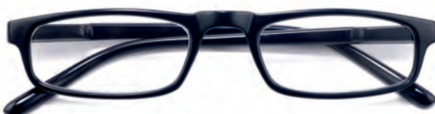
Montatura nera, aste nere