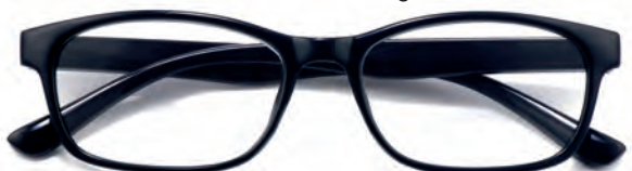
Montatura nera, aste nere