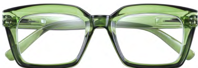
Mod. Brave verde