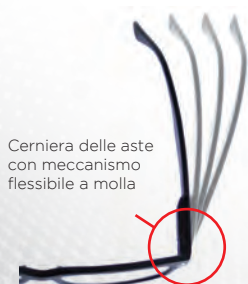
Cerniera delle aste con meccanismo flessibile a molla