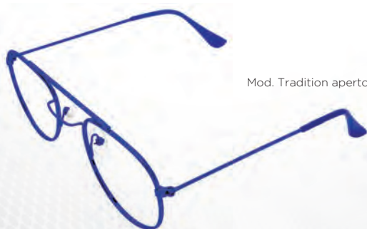
Mod. Tradition aperto