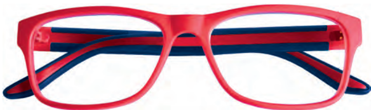
Mod. Street frontale rosso, aste blu