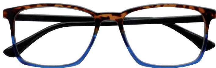
Mod. Double frontale tartaruga/blu, aste nere