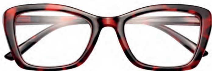
Mod. Lady tartaruga/marrone