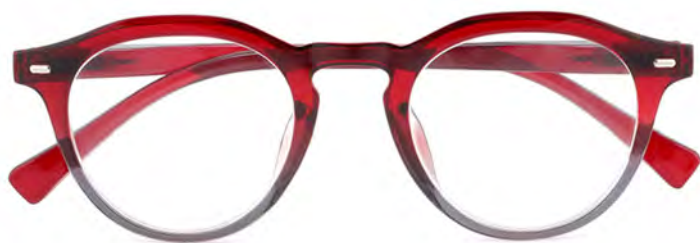
Mod. Elegance - Rosso crystal