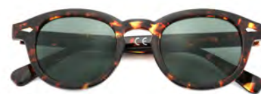
Montatura colore tartaruga, lenti colore verde