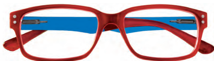
Mod. Mixer frontale rosso, con aste azzurre e terminali rossi