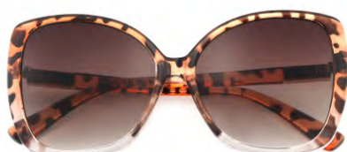
Montatura colore tartaruga crystal, lenti colore marrone