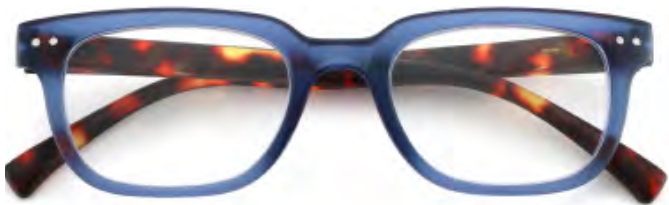
Mod. Royal blu