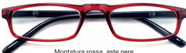
Montatura rossa, aste nere