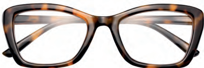
Mod. Lady tartaruga/marrone