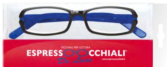
Vista frontale della confezione.