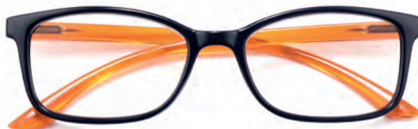
Montatura nera, aste arancioni