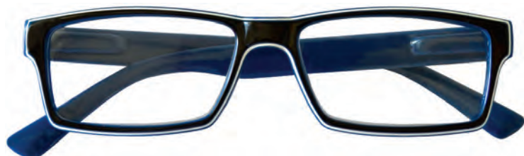
Mod. Luster frontale nero con bordo bianco ed interno blu