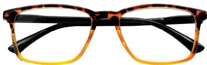
Mod. Double frontale tartaruga/giallo, aste nere