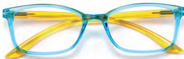
Montatura azzurra, aste gialle