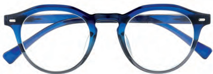
Mod. Elegance - Blu crystal