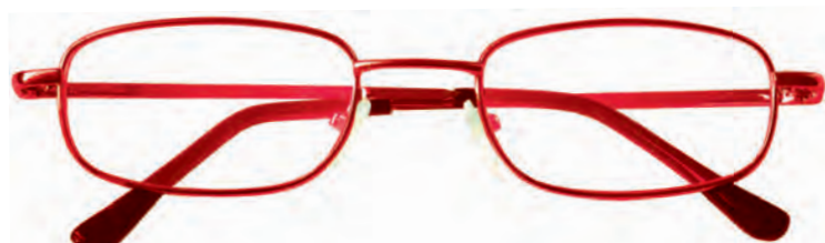
Mod. Classic 2 rosso