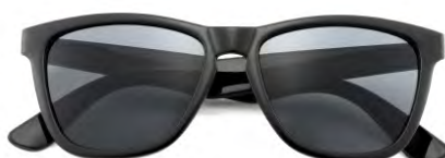
Montatura colore nero, lenti colore grigio