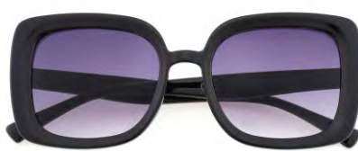
Montatura colore nero, lenti colore viola