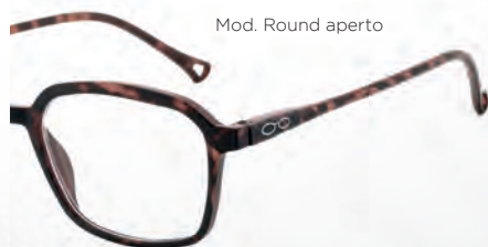
Mod. Round aperto