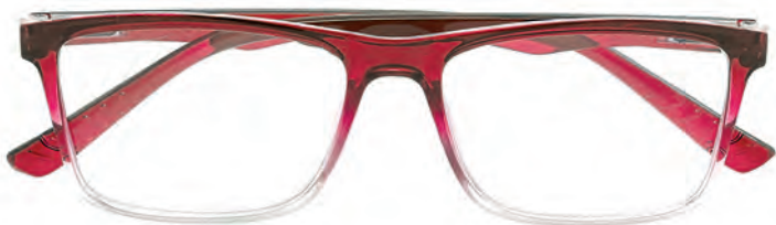
Mod. Glamour frontale superiore e aste rosso - frontale inferiore trasparente