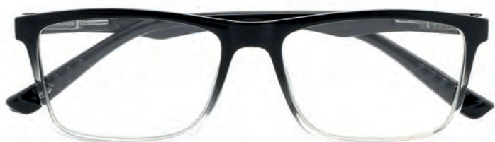
Mod. Glamour frontale superiore e aste nero - frontale inferiore trasparente