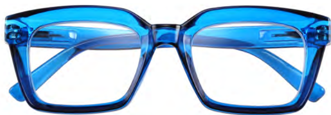
Mod. Brave blu