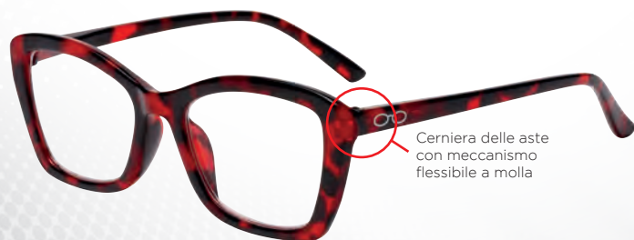
Cerniera delle aste con meccanismo flessibile a molla