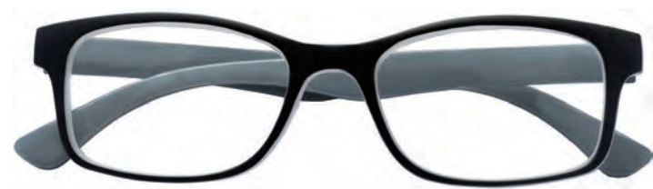
Mod. Freedom nero/grigio