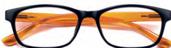
Montatura nera, aste arancioni