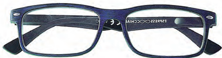
Mod. Wood blu