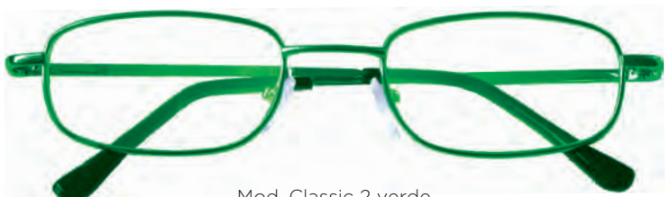
Mod. Classic 2 verde