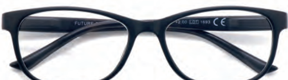
Montatura nera, aste nere