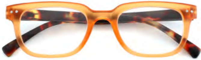
Mod. Royal arancio