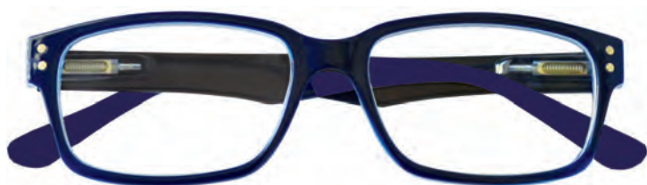
Mod. Mixer frontale blu, con aste nere e terminali blu