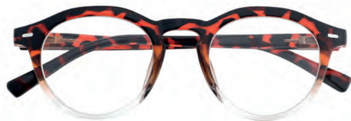
Mod. Elegance - Tartaruga crystal