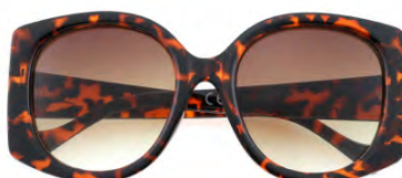
Montatura colore tartaruga, lenti colore marrone