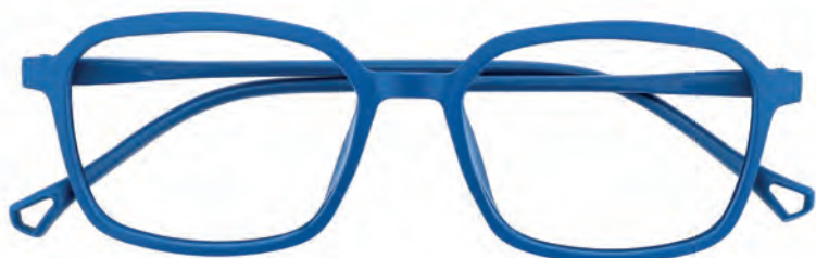
Mod. Silhouette blu