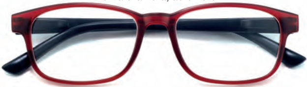
Montatura rossa, aste nere