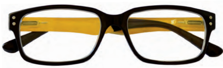
Mod. Mixer frontale nero, con aste gialle e terminali neri