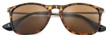
Montatura colore tartaruga, lenti colore marrone