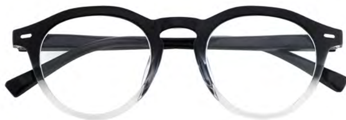
Mod. Elegance - Nero crystal