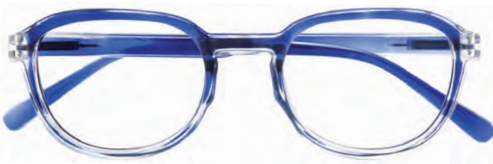
Mod. Shot blu cangiante