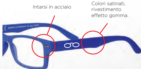
Intarsi in acciaio