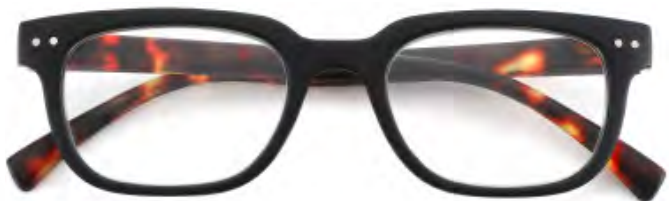
Mod. Royal nero