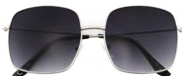
Montatura colore argento lenti colore grigio