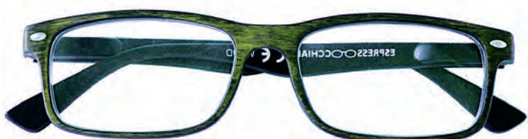
Mod. Wood verde