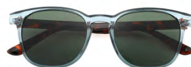
Montatura colore azzurro crystal, lenti colore grigio