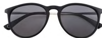
Montatura colore nero, lenti colore grigio