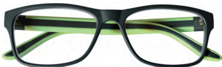
Mod. Street frontale verde scuro, aste verde chiaro