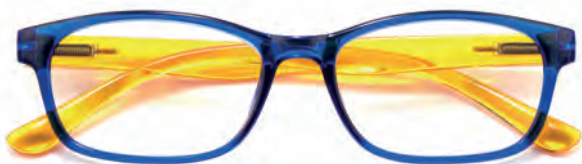
Montatura blu, aste gialle