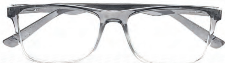
Mod. Glamour frontale superiore e aste grigio - frontale inferiore trasparente