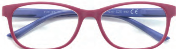
Montatura rossa, aste blu