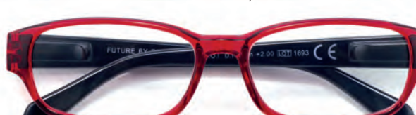
Montatura rossa, aste nere