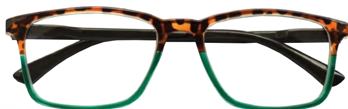
Mod. Double frontale tartaruga/verde, aste nere