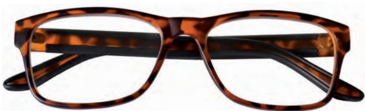
Mod. Street frontale tartaruga, aste nere