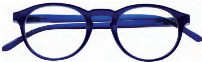
Mod. Round blu