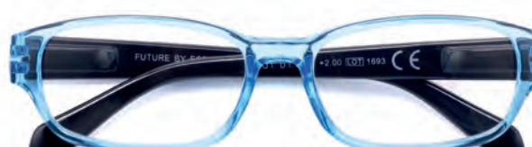
Montatura azzurra, aste nere