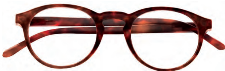
Mod. Round tartaruga