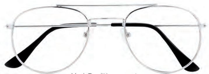
Mod. Tradition argento