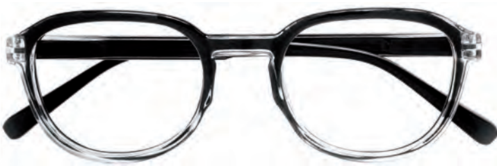
Mod. Shot nero cangiante