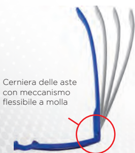
Cerniera delle aste con meccanismo flessibile a molla