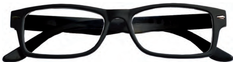
Mod. Boss nero