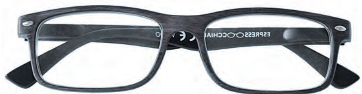
Mod. Wood grigio