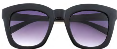
Montatura colore nero, lenti colore viola