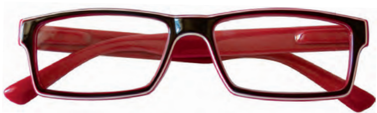
Mod. Luster frontale nero con bordo bianco ed interno rosso