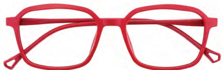
Mod. Silhouette rosso