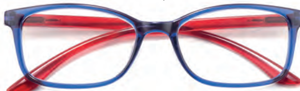
Montatura blu, aste rosse