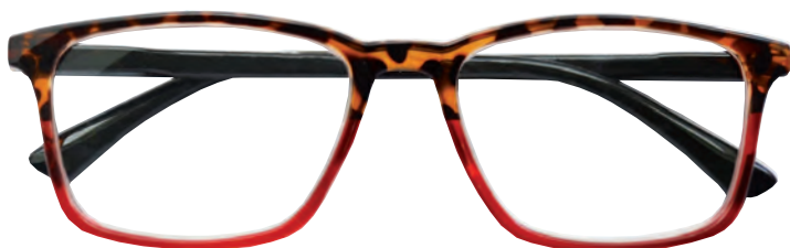
Mod. Double frontale tartaruga/rosso, aste nere