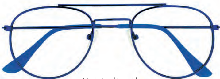
Mod. Tradition blu