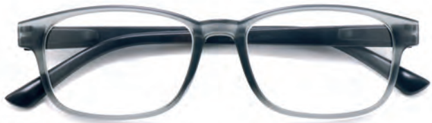
Montatura grigia, aste nere