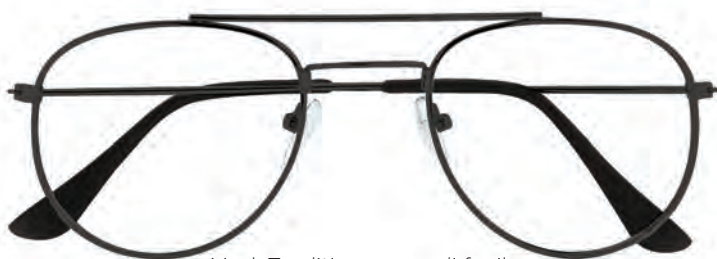
Mod. Tradition canna di fucile