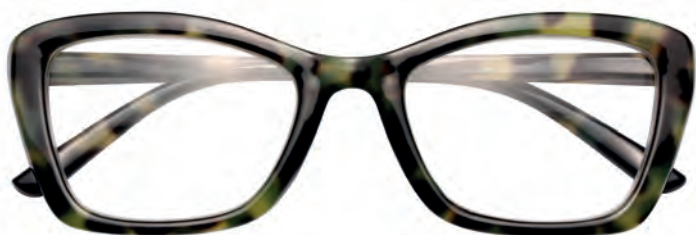
Mod. Lady tartaruga/verde