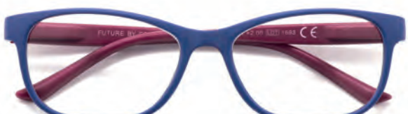
Montatura blu, aste rosse