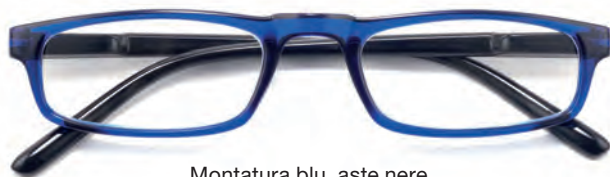
Montatura blu, aste nere