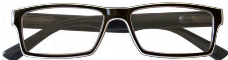
Mod. Luster frontale nero con bordo bianco ed interno grigio