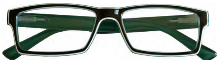
Mod. Luster frontale nero con bordo bianco ed interno verde