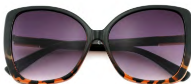
Montatura colore nero e tartaruga, lenti colore viola