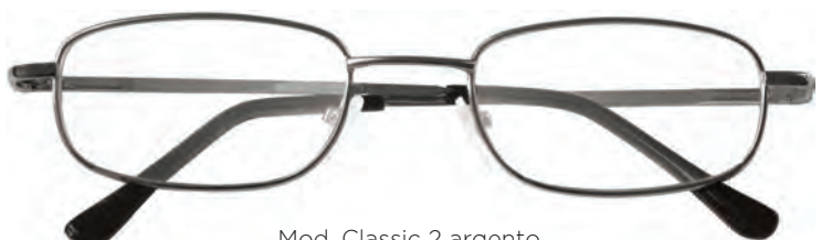
Mod. Classic 2 argento