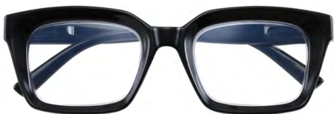
Mod. Brave nero