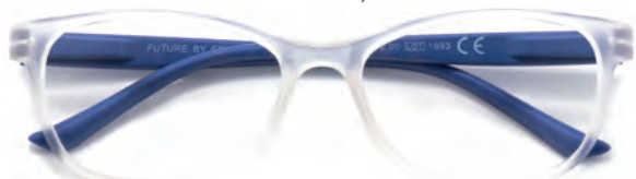
Montatura trasparente, aste blu