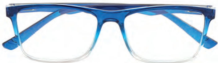
Mod. Glamour frontale superiore e aste blu - frontale inferiore trasparente