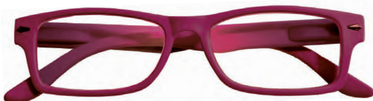
Mod. Boss rosso