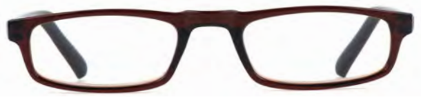
Montatura marrone, aste nere