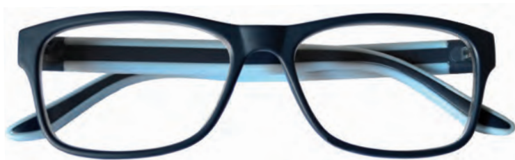
Mod. Street frontale blu, aste azzurre