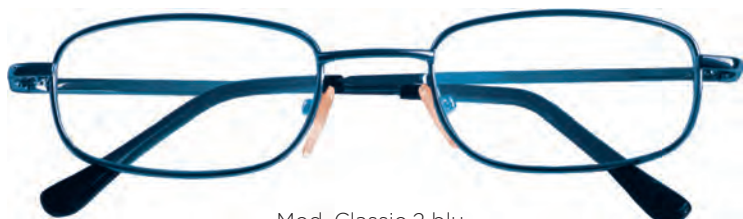
Mod. Classic 2 blu