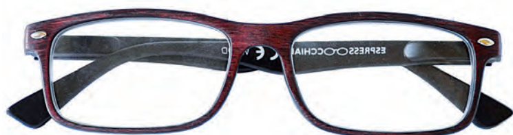
Mod. Wood rosso