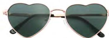
Montatura colore oro lenti colore verde

Per questo kit, sono disponibili gli espositori cod. 1200 / cod. 1180 / cod. 1390 / cod. 1391. visibili a p.20 e 21 di questo catalogo