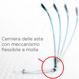
Cerniera delle aste con meccanismo flessibile a molla