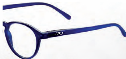
Mod. Round con astina aperta