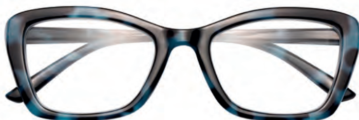
Mod. Lady tartaruga/blu