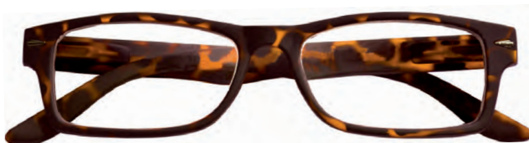
Mod. Boss tartaruga