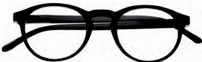
Mod. Round nero