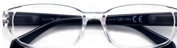
Montatura trasparente, aste nere