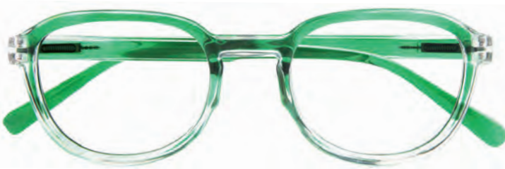
Mod. Shot verde cangiante