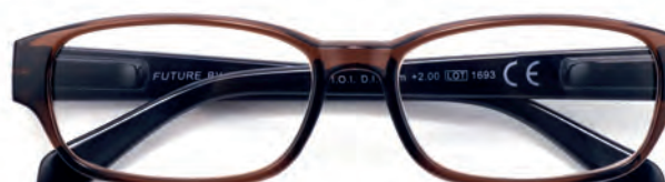
Montatura marrone, aste nere