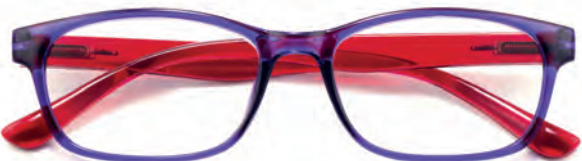
Montatura viola, aste rosse