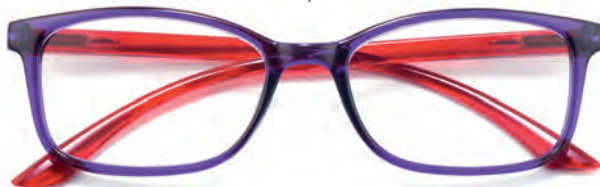
Montatura viola, aste rosse