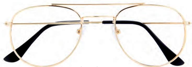
Mod. Tradition oro