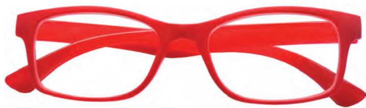
Mod. Freedom rosso