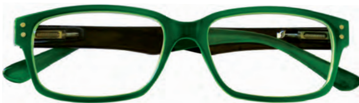
Mod. Mixer frontale verde, con aste nere e terminali verdi