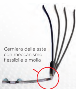
Cerniera delle aste con meccanismo flessibile a molla