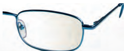
Mod. Classic 2 con astina aperta